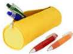
Trousse avec stylo bille, etc. (déjà dans les autres matières)