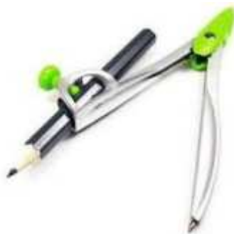
Un compas (Déjà en math !)