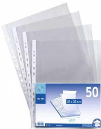
Des pochettes plastiques perforées (Déjà normalement !)