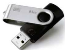
Une clé USB (facultatif mais utile pour emporter ou apporter des fichiers)

(Possible de mutualiser avec d'autres matières)