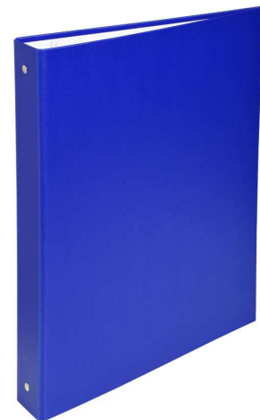
Un classeur moyen pour ranger les documents